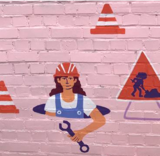
Ouvrière travaux public