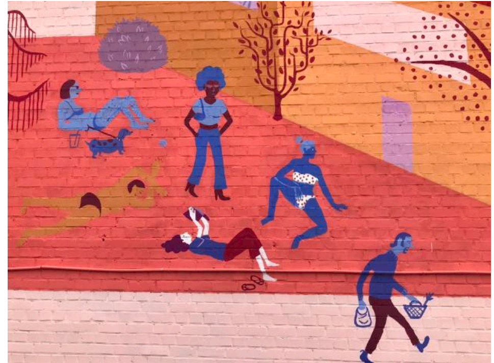
Bronzette en bord de Meuse en toute tranquillité