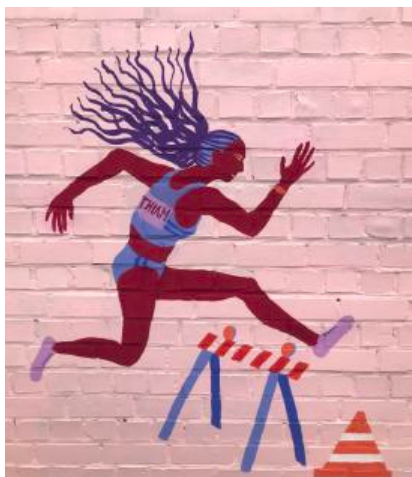
Nafissatou Thiam athlète