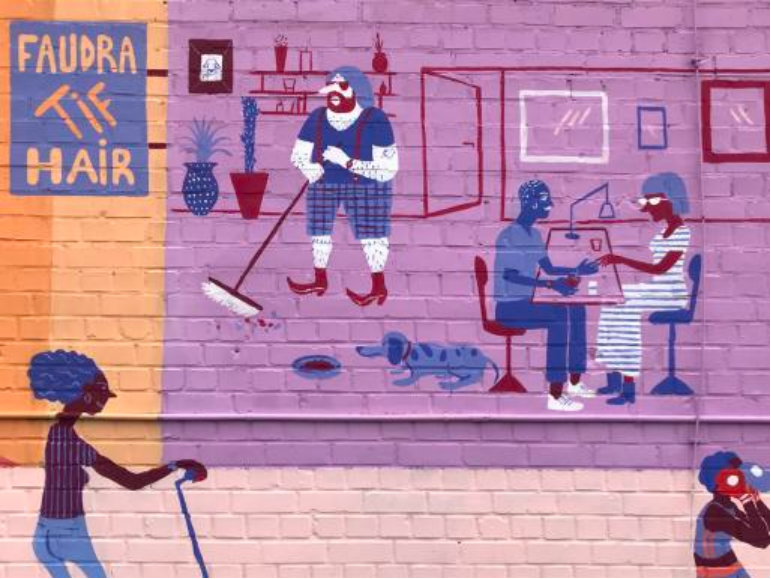
Coiffeur / Onglerie «FAUDRA TIF HAIR»