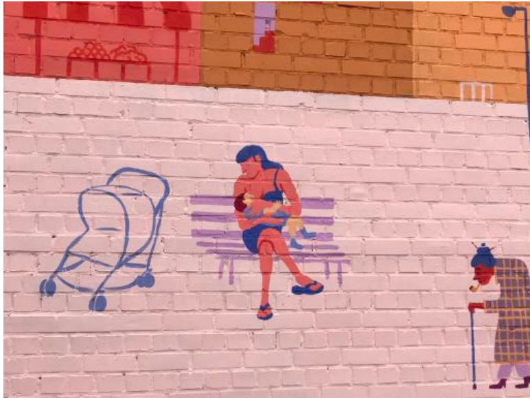
Allaitement dans l'espace public