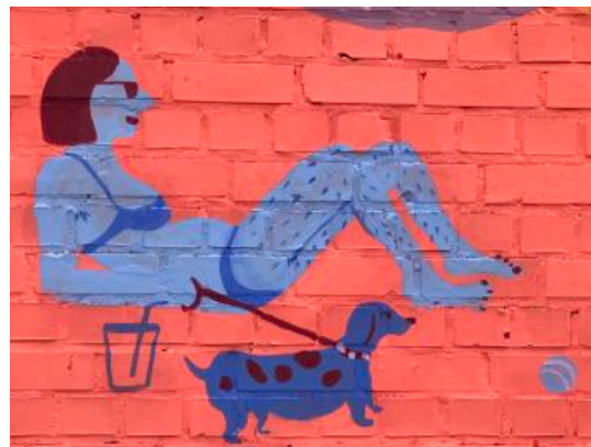
Poils dans l'espace public !