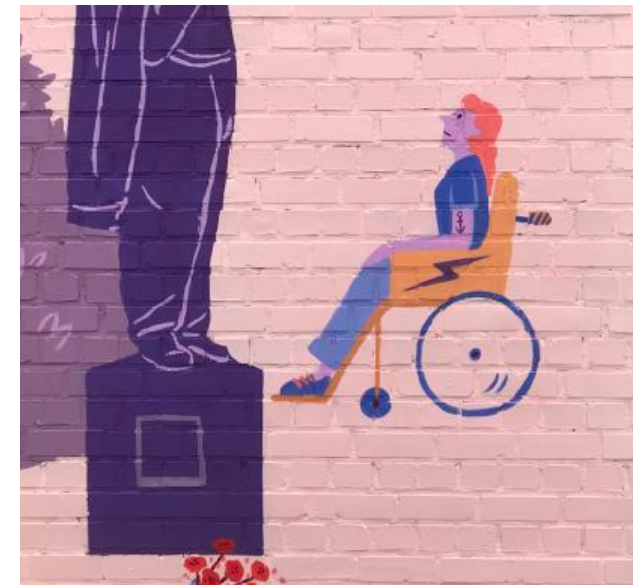
Accessibilité et visibilité des personnes porteuses de handicap