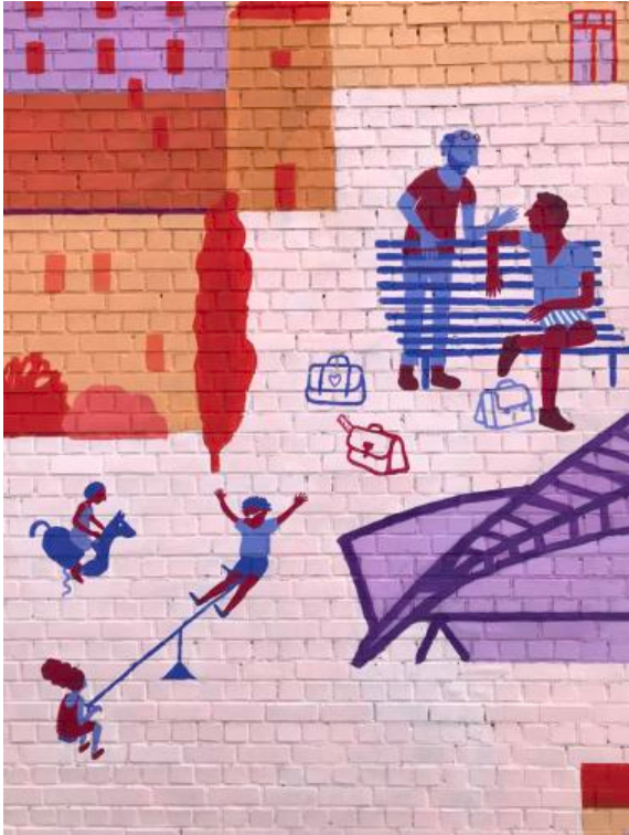
Pères dans les aires de jeux