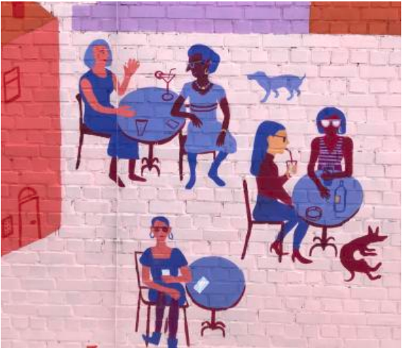
Mères en terrasse de cafés