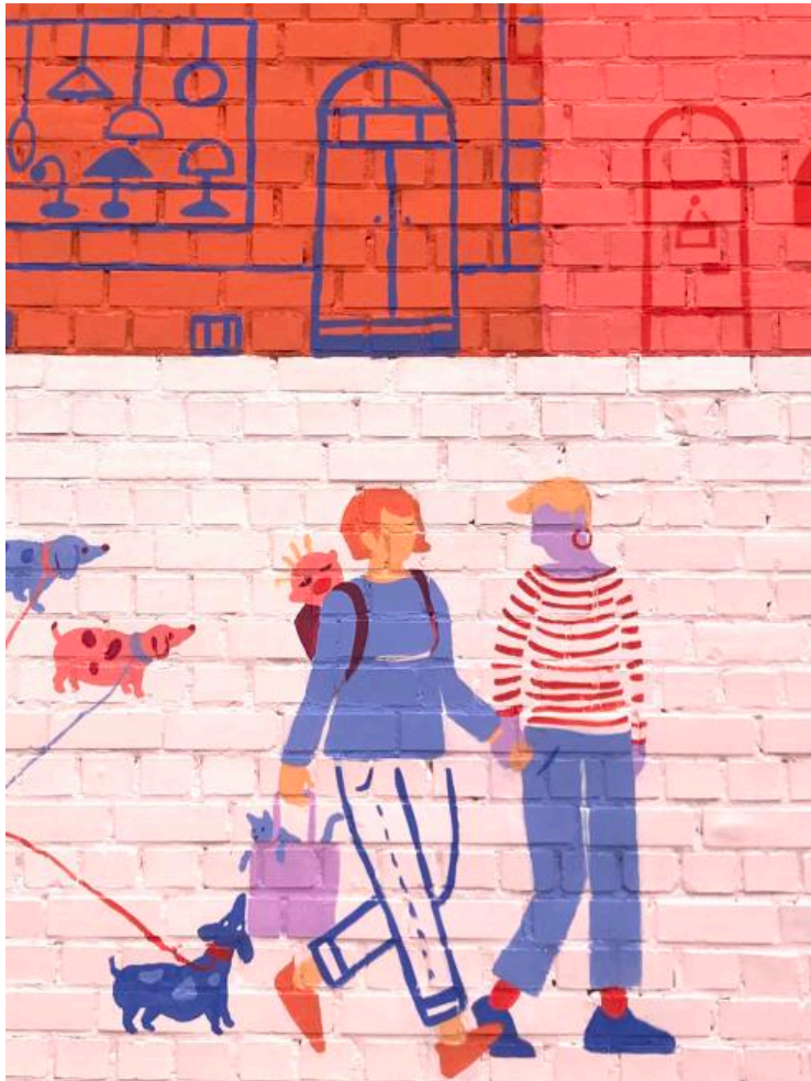
Couple de femmes se tenant par la main